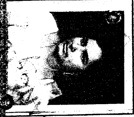
आरेक की पत्नी WIFE

I-694762 आरेक की फोटो PHOTOGRAPH OF BEARER